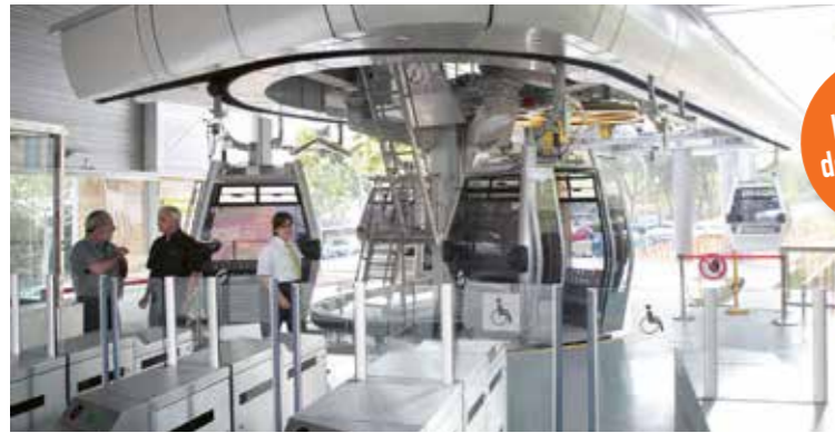
L'exemple de Barcelone

Comme dans toutes les métropoles, il est difficile de se déplacer à Toulouse. Et plus qu'ailleurs en France, la population de l'agglomération augmente vite, très vite !