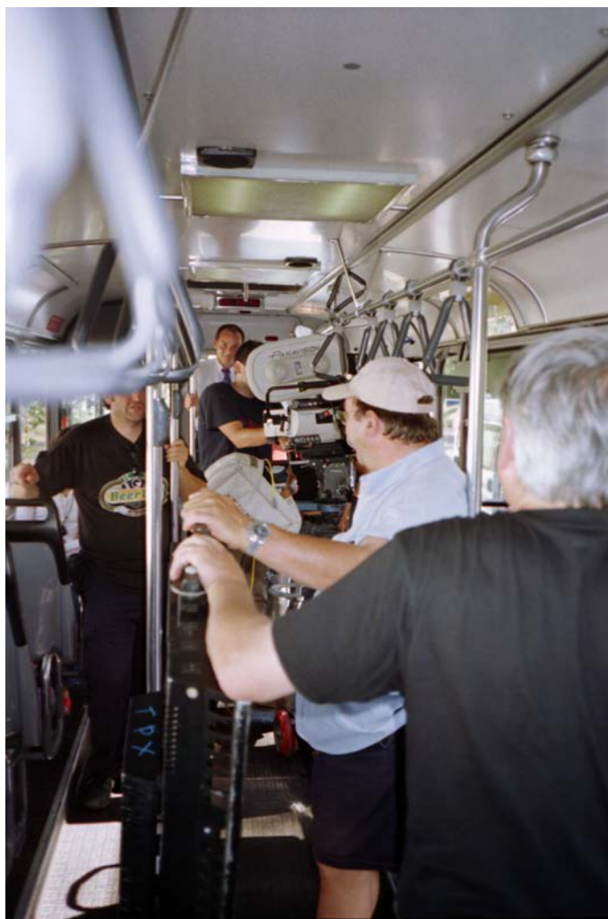
Serveur COMINT- photothèque - Lemming