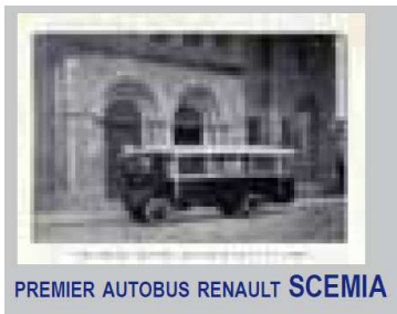
PREMIER AUTOBUS RENAULT SCEMIA