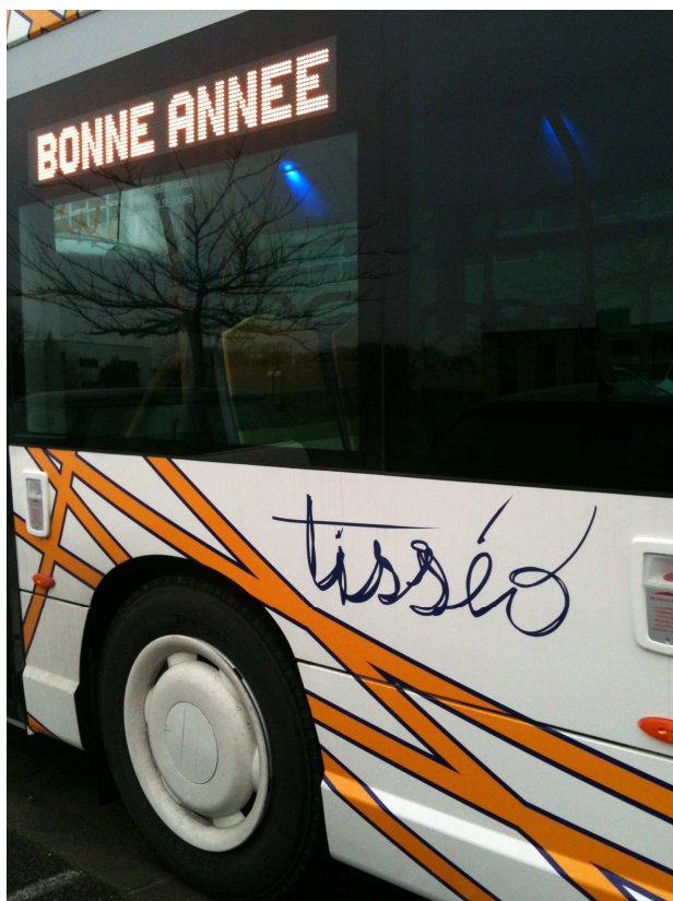
Place du Capitole, le 11 janvier 2013