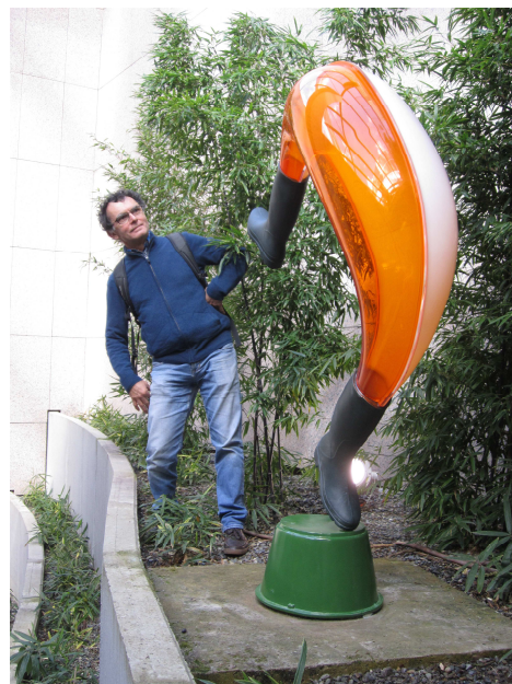
L'artiste Claude CAILLOL devant une des sculptures du jardin

Après la restauration de l'œuvre de la station de métro Fontaine Lestang, celle de Marengo-SNCF et Saint-Cyprien République, c'est au tour de l'œuvre de Claude Caillol et Judith Bartolani de la station de métro Rangueil, d'être réinstallée après une méticuleuse restauration.