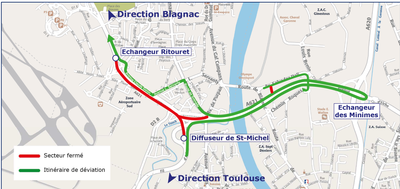
Fermeture les nuits du 14 au 15 mai 2014 de 20h30 à 5h30 dans le sens Toulouse-Bagnac