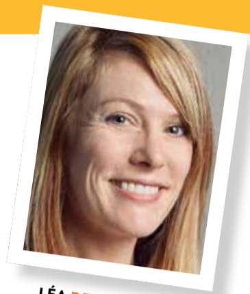
LÉA DE L'ACCUEIL

30 MARS > 3 AVRIL SEMAINE DU COVOITURAGE