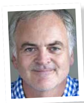
JEAN DE LA LOGISTIQUE