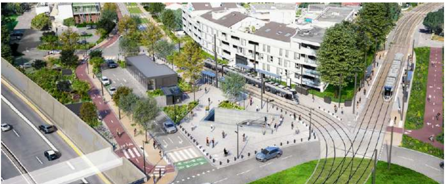
Vue de la future station Blagnac interconnectée aux lignes de Tram T1, Ligne Aéroport et Ligne C de métro à l'horizon 2028.

À l'horizon 2028 , avec la mise en service de la Ligne C , il sera possible de rejoindre l'aéroport depuis la gare Matabiau, via la nouvelle station Blagnac, en seulement 22 minutes !