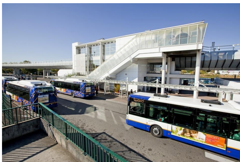
Pôle d'échange Basso Cambo

TER et TAMtam A, B, C, D, E et F à la gare de Muret