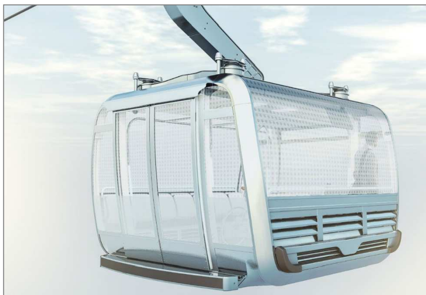
Exemple de design extérieur des cabines Groupement POMA