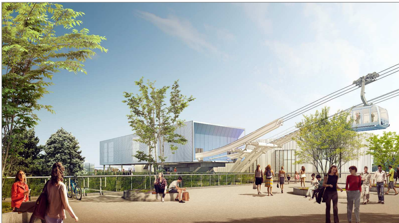
Groupement POMA / Architectes-urbanistes : SEQUENCES / Images : Les Yeux Carrés Station Oncopole

Les aérations présentes sur les cabines sont conçues de manière à rendre impossible tout jet d'objet sur les sites survolés. Chaque cabine est reliée par interphonie et vidéosurveillance à chacune des 3 stations.