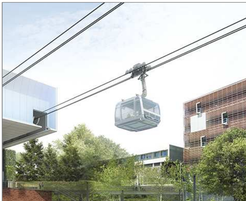
Groupement POMA / Architectes-urbanistes : SEQUENCES / Images : Les Yeux Carrés Station Rangueil

Fin 2020, ce mode de transport innovant sera mis en service. Il reliera l'université Paul Sabatier à l'Oncopole en passant par le CHU Rangueil. Son tracé d'une longueur de 3 km en fait le téléphérique urbain le plus long de France.