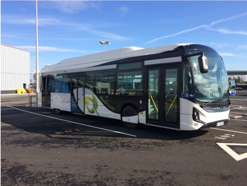
Modèle GX 337 E d'Heuliez