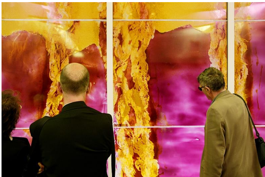
Ligne B Station Saouzelong – Œuvre sans titre de Monique Frydman