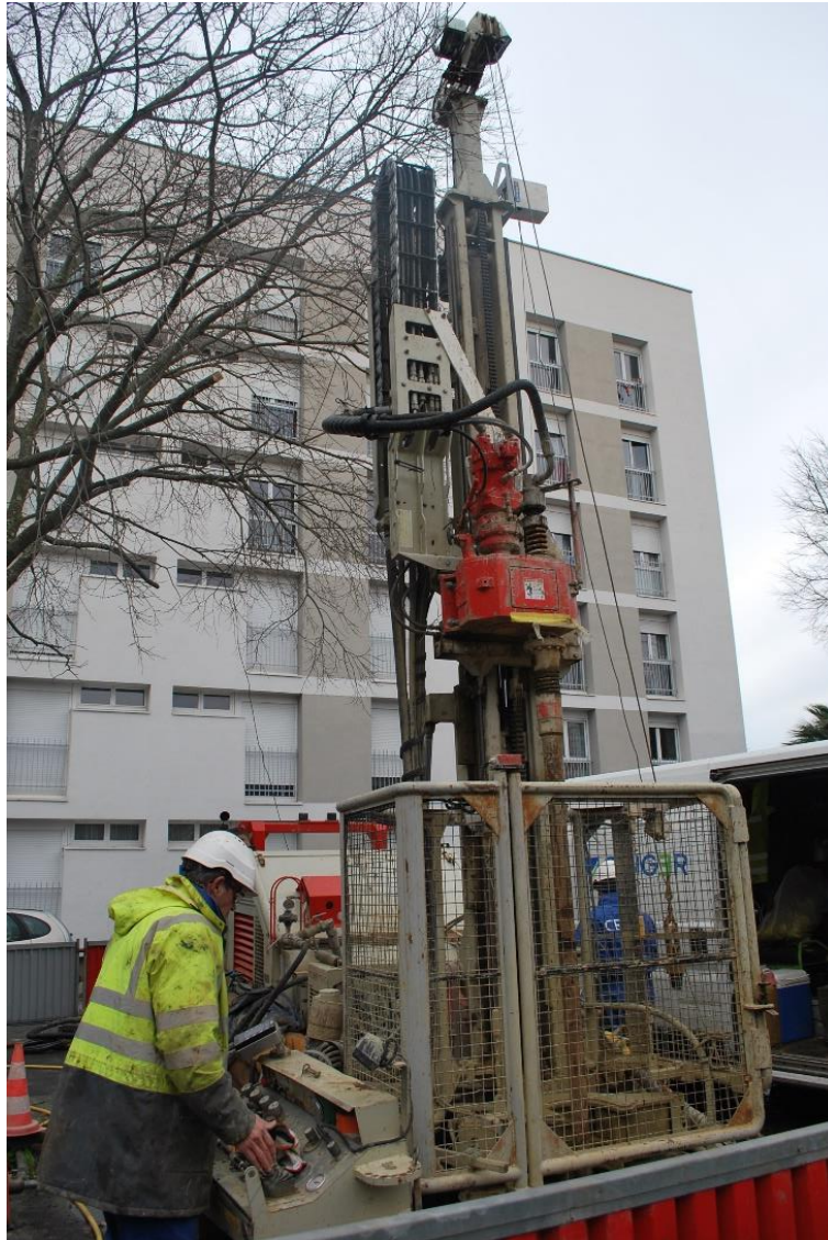
La foreuse - place Beteille