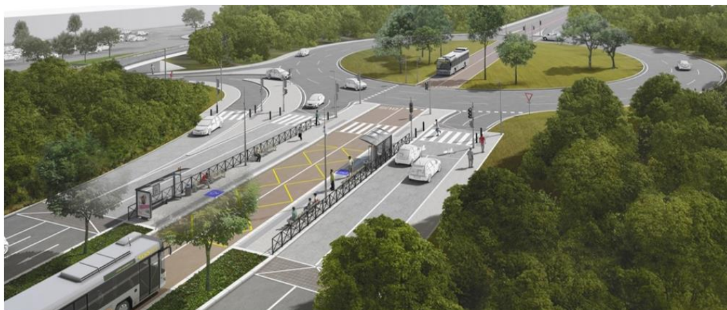
Rond-point Michaelis à Roques